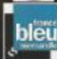
Illustration par nos soins - Art par www.art4you.com